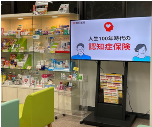
ミアヘルサ日生薬局大井町店の様子